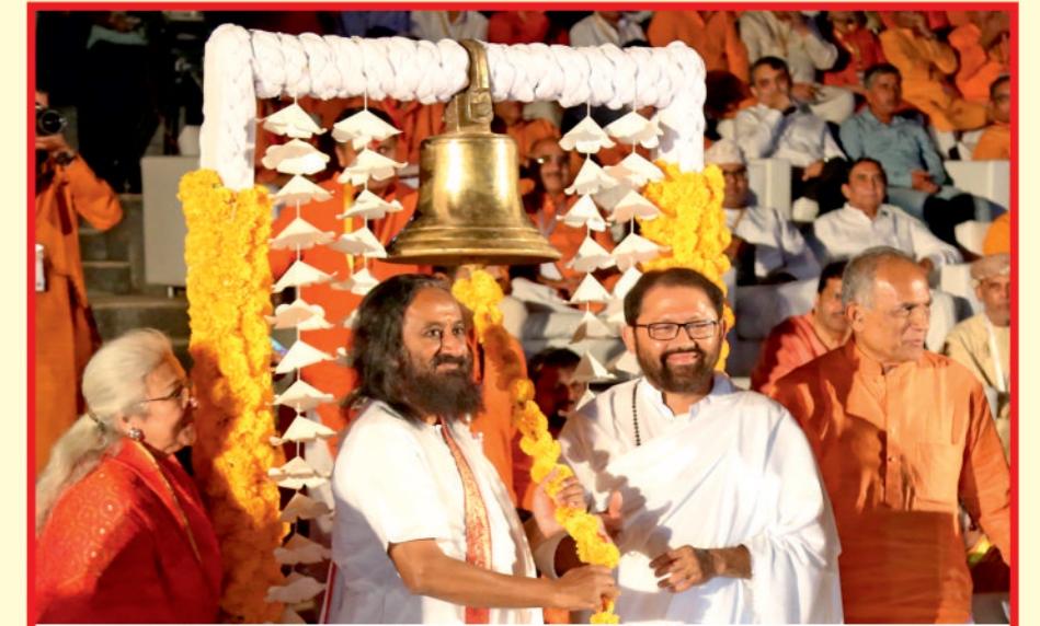
શ્રી શ્રી રવિશંકરજી અને પૂજ્ય ગુરુદેવશ્રી રાકેશભાઈના શુભહસ્તે શ્રીમદ્ રાજચંદ્રજીની ભવ્ય પ્રતિમાનું અનાવરણ