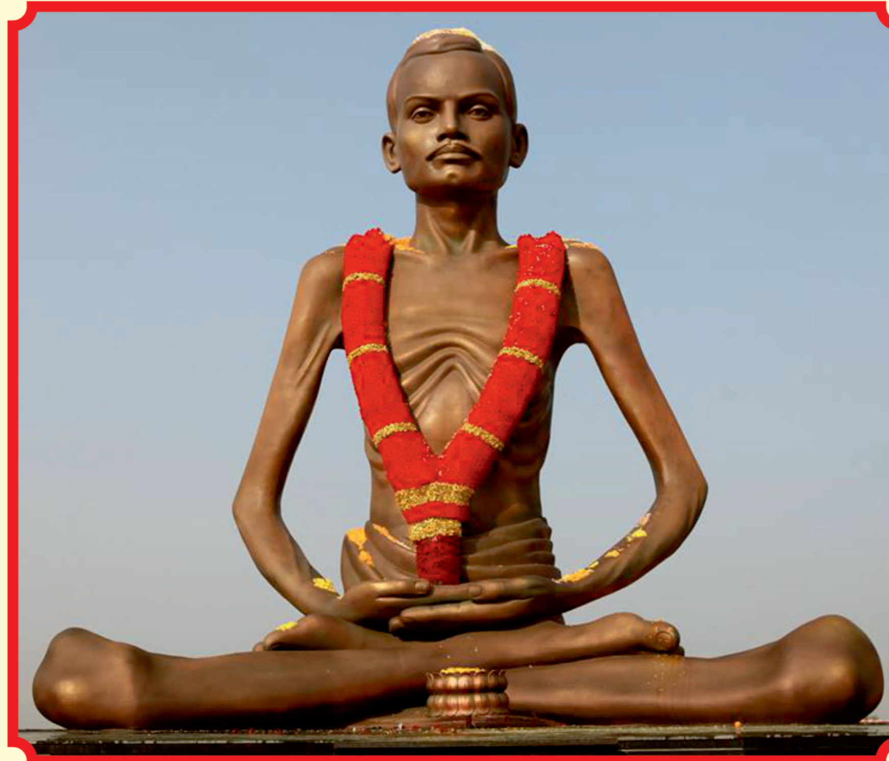
શ્રીમદ્ રાજચંદ્ર આશ્રમ, ધરમપુરમાં આવેલ ૩૪ ફૂટની પદ્માસન મુદ્રામાં શ્રીમદ્ રાજચંદ્રજીની વિશ્વની સર્વોચ્ચ પ્રતિમા