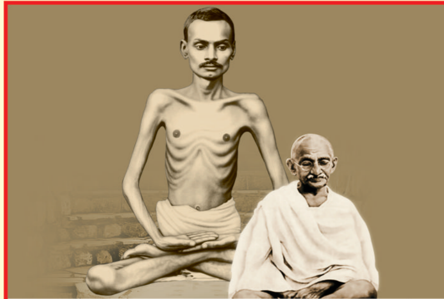
યુગ પુરુષ - મહાત્મા ના મહાત્મા નાટકના એક વર્ષમાં ૧૦૦૪ પ્રયોગ