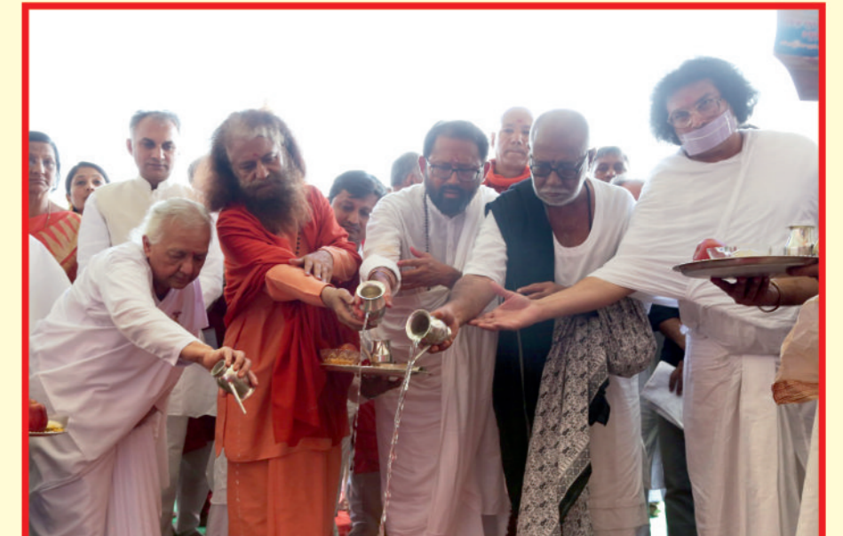
૨૫૦ બેડની સુવિધા ધરાવનાર શ્રીમદ્ રાજચંદ્ર હોસ્પિટલના ખાત મુહુર્ત વિધિ કરતાં સંતો