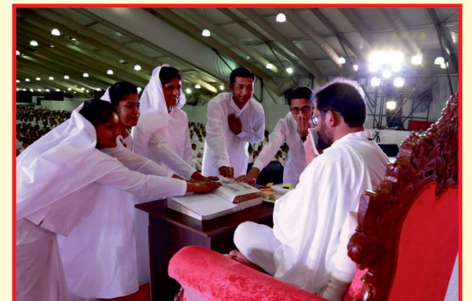
શ્રીમદ્ રાજચંદ્રજીના સાર્ધ શતાબ્દી મહોત્સવ સમયે ૫ આત્માર્પિતોનો દીક્ષા ગ્રહણ પ્રસંગ